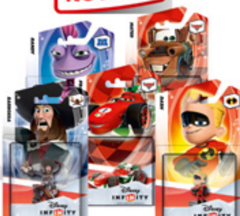
Figura DISNEY Infinity